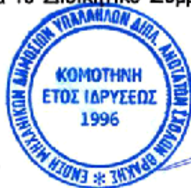
Τάνια Βεζυριαννίδου Αρχιτέκτων Μηχανικός